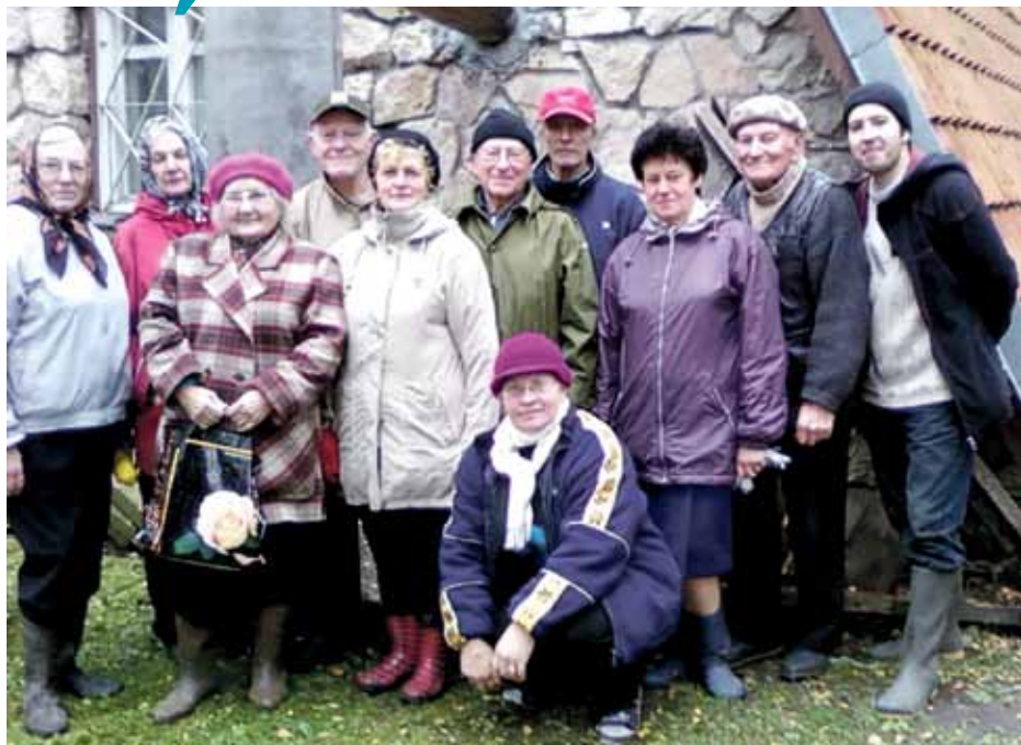
Rudens talkas dalībnieki

Cik ātri steidzas laiks, tā vien šķiet, ka nesen vēl bija vasaras gaišās dienas un agro rītu burvīgums, bet, pilnu klēpi ar raibraibām lapām ņēmis, garām jau aizsteidz rudens. Līdz ar krēslainajiem novakariem atnācis arī veļu laiks, kad steidzam padarīt to, ko neesam spējuši lietainā un vēsā laika dēļ. 29. oktobrī Saulkrastu kapsētā pulcējās darbīgi cilvēki uz ikkgadējo rudens talku. Nu jau tas kļuvis par tradīciju – pirms Svecīšu vakara sakopt kapsētas teritoriju.